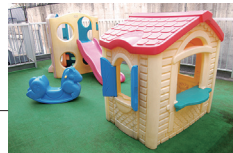
待合室横の屋外キッズスペース