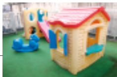
待合室横の屋外キッズスペース